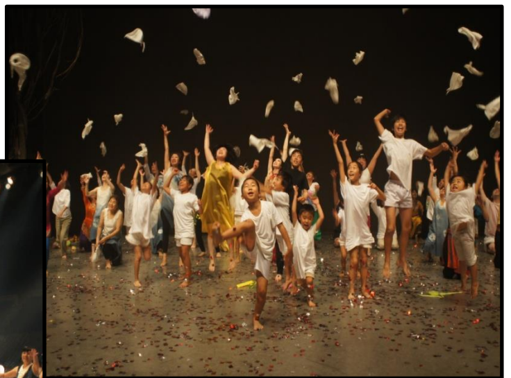
過去の公演の様子