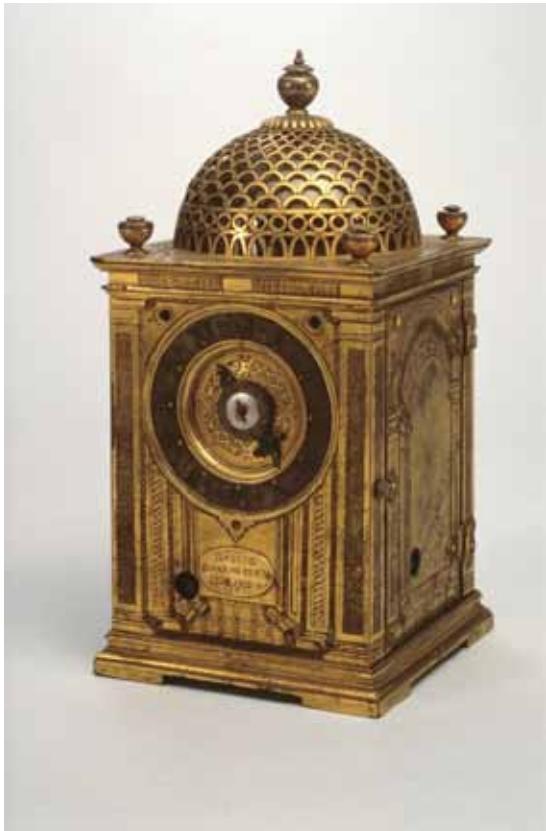
重要文化財「洋時計 (1581年マドリッド製刻銘)」 (展示: 10/4-11/9) 久能山東照宮博物館蔵