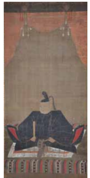
「東照大権現像」絵本山 長谷寺蔵