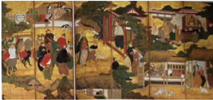
「南蛮屏風」右隻（静岡来迎院旧蔵）宮内庁三の丸尚蔵館蔵