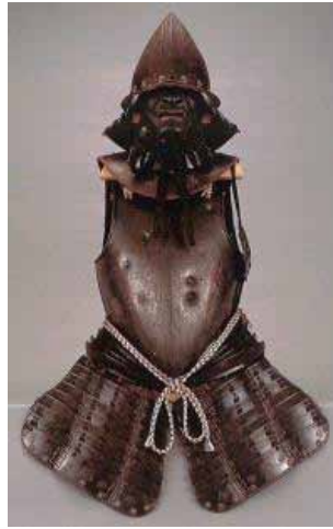
重要文化財「南蛮胴具足」紀州東照宮蔵

家康遺愛品の数々を南蛮趣味に注目して紹介するほか、久能山秘蔵の御神宝装束を紹介。神服装束としての白の束帯は、三代將軍家光が祖父・家康を心から崇拜し、久能山に奉納したであろうもの。これらにちなんで全国から家康ゆかりの品々が里帰りする。