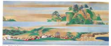
和歌山県立指定文化財「東照社縁起絵巻」紀州東照宮蔵