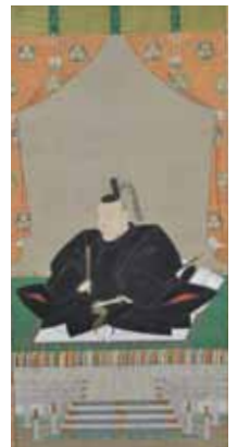
「徳川秀忠像」総本山長谷寺蔵