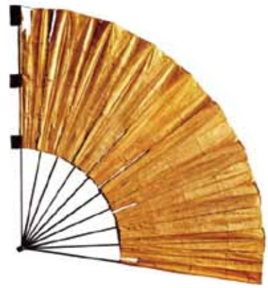
「金扇馬印」久能山東照宮博物館蔵