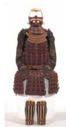
「茶絲威具足」久能山東照宮博物館蔵