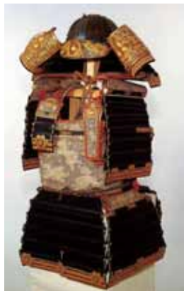
「紺絲威鎧」久能山東照宮博物館蔵