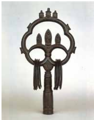
重要文化財「金銅錫杖頭」鉄舟寺蔵

家康はなぜ久能山という場を選んだのか。古代中世の久能山には、久能寺（現・鉄舟寺）が創建され、霊山、霊場として機能してきた。本章では、久能山東照宮が建立される前の久能山の様相を「久能寺縁起」や平家納経と並ぶ三大装飾経として知られる国宝「久能寺経」により往時の繁栄をしのぶ。