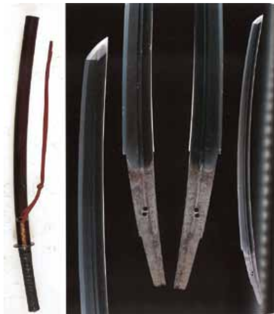
重要文化財「太刀 三池典太」久能山東照宮博物館蔵

家康の生涯をビジュアルに伝える「東照宮縁起絵巻」（紀州東照宮蔵）、武具（「金溜塗頭形兜」「南蛮胴具足」「齒朶具足」）などにより、戦国の覇者から神（東照大権現）になるまでを紹介。