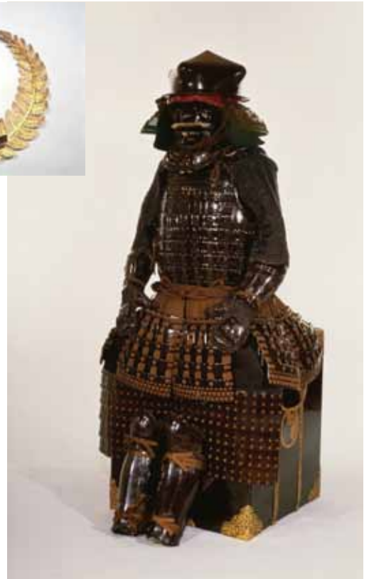
重要文化財「伊予札黒糸威胴丸具足(歯染具足)」 (展示: 10/21-11/24) 久能山東照宮博物館蔵