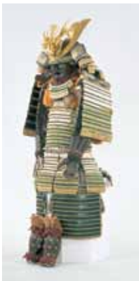
「卯花威胴丸」久能山東照宮博物館蔵