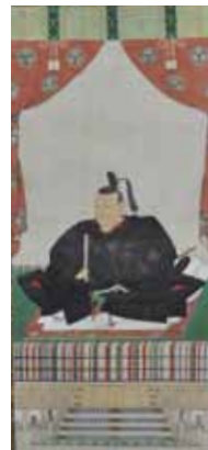
「徳川吉宗像」総本山長谷寺蔵