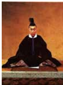
玉置金司・矢崎千代治筆「徳川慶喜像」久能山東照宮博物館蔵