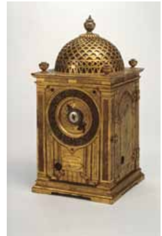
重要文化財「洋時計（1581年マドリッド製刻銘）」久能山東照宮博物館蔵