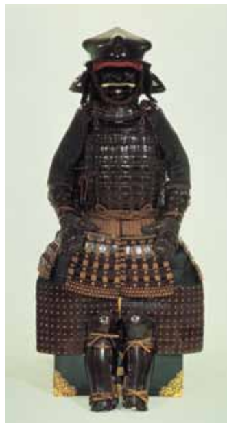
重要文化財「伊予札黒糸威胴丸具足（齒朶具足）」久能山東照宮博物館蔵