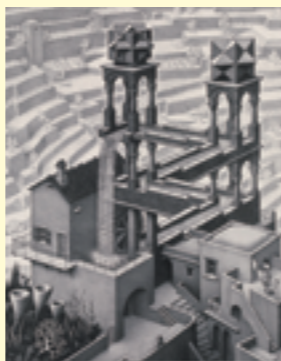
M.C. エッシャー (獨) 1961年、リトグラフ All M.C. Escher works copyright © The M.C. Escher Company B.V. - Baarn-Holland, www.mcescher.com