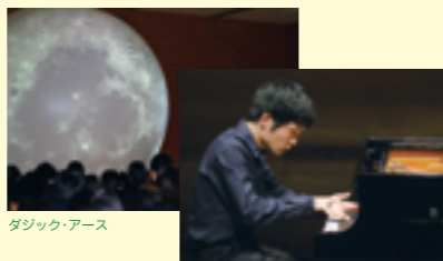
ダジック・アース