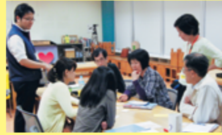
科学コミュニケーター育成講座

文化に興味を持った人が、文化に触れ、体験し、文化を広げる人となっていく様子を、芽が出て、花が咲き、種をとばすタンポポのイメージで表現しました。